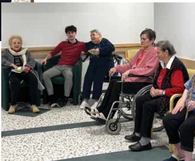
Fotografiji sta simboli

Deljenje družinske zgodovine, tudi boleče, jim lahko pomaga razumeti njihove občutke. Ko otrok spozna, da določeni strahovi ali občutki niso nujno njegovi, temveč del širše družinske zgodbe, lahko občuti veliko olajšanje. Razume, da z njim ni nič narobe.