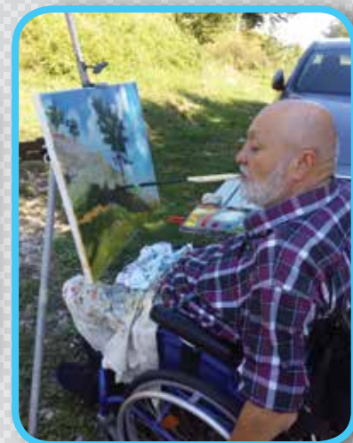
Umetniki za Karitas na Sinjem vrhu