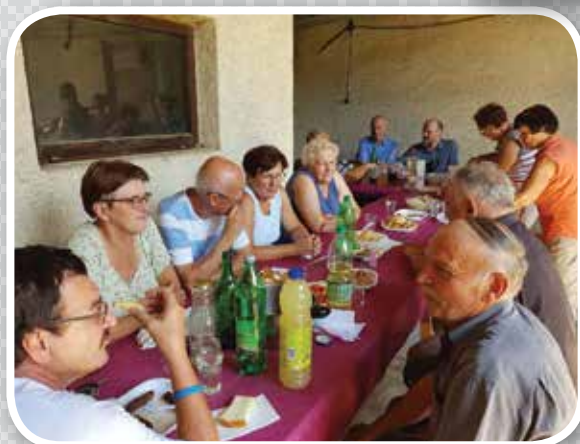
Druženje sodelavcev ŽK Črnomelj po napornem juniju in juliju, ko so bili na voljo ljudem po neurju s točo

QR koda za dostop do Žarka dobrote na internetni strani preko sodobnih spletnih bralnikov.