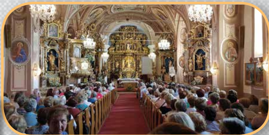
Sodelavci ŽK nadškofije Maribor na romanju na Ptujski Gori

Ustvarjanje na letovanjih družin in otrok v Portorožu