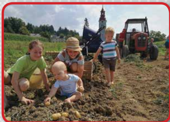
Druženje ob koristnem delu

Avgust je prinesel več časa za druženje, skupni klepet, romanja in ustvarjanje.