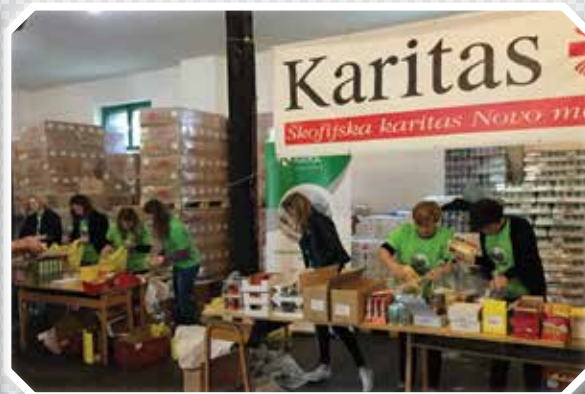
Krka d.d. in Škofijska karitas Novo mesto, sta zopet združili moči v tednu humanosti in prostovoljstva.

QR koda za dostop do Žarka dobrote na internetni strani preko sodobnih spletnih bralnikov.