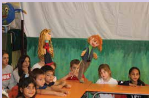
Otroci OŠ v Knjaževacu so predstavili svoje prostovoljsko delo s pomočjo lutk