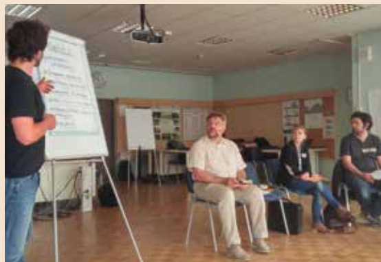
Srečanje je potekalo predvsem v smislu delavnic in podajanja izkušenj iz naših preteklih dogajanj in sodelovanj z migranti

Udeleženi smo imeli na začetku delavnico spoznavanja in izmenjavo izkušenj v delu z begunci nasploh. Spoznali smo terminologijo, pravni okvir in pravice migrantov, ki nam jih je predstavil mag. Franci Zla-