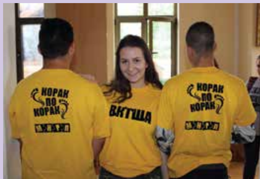
Mladi iz Aleksinca so si natisnili majice s sloganom projekta Korak za korakom

Prvi del projekta, ki je potekal pod sloganom »Kaplja na kapljo« , je bil namenjen različnim aktivnostim osveščanja mladih o ekologiji , s poudarkom na ohranjanju čistih voda. Od jeseni 2015 dalje pa so v okviru projekta potekale aktivnosti za mlade osnovnih in srednjih šol v Centralni Srbiji v povezavi z aktivnim državljanstvom in prostovoljstvom pod sloganom »Korak za korakom« . Sodelavci Karitas beograjske nadškofije so za učitelje pripravili praktični priročnik z