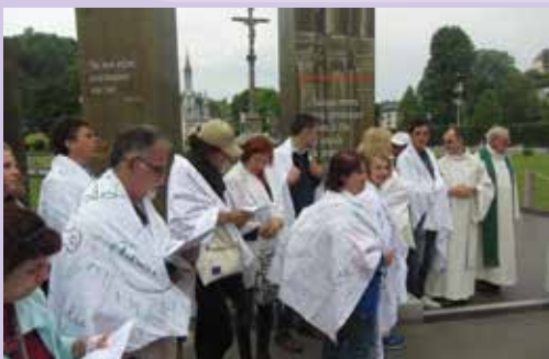
Pred svetimi vrati v Lurdu smo odlozili vse kar nas loči na poti do Jezusa