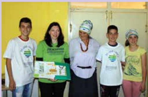
Učenci, vodja prostovoljske akcije in predstavnica MZZ na OŠ Vladimirci

različnimi delavnicami, izvedli 10 regionalnih izobraževanj za učitelje in za posamezne učence (multiplikatorje) na temo aktivnega državljanstva in prostovoljstva. V aprilu in maju 2016 pa je kot zaključni del projekta po šolah potekal nagradni natečaj za najboljšo izvedeno prostovoljsko akcijo v sklopu šole ali lokalne skupnosti . Sodelavci Karitas so iz šol iz različnih krajev prejeli 145 kratkih video-/fotografij o izvedenih prostovoljskih akcijah, ki jih bo sedaj ocenjevala komisija.