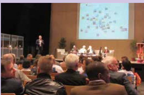
Generalni tajnik Caritas Europa - Jorge Nuno Mayer predstavlja vse udeležene države na konferenci