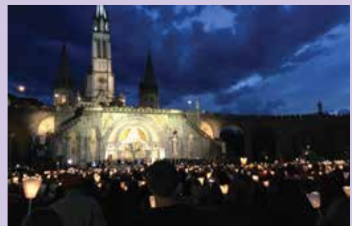
Procesija pred baziliko