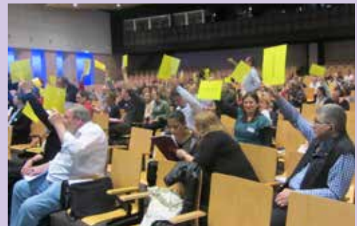
Potrditev letnih poročil, načrtov za naprej in strateškega načrta Caritas Europa