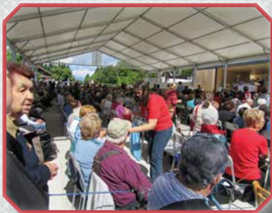
»Žejen sem bil in ste mi dali piti.« Na romanju ostarelih, bolnikov in invalidov na Brezjah