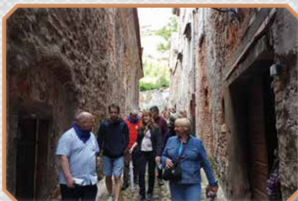
»Po skrivnostnih ulicah Ptuj...«