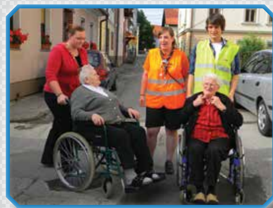
»Mladost in starost skupaj na poti« Srečanje za ostarele in bolnih v Črnomlju