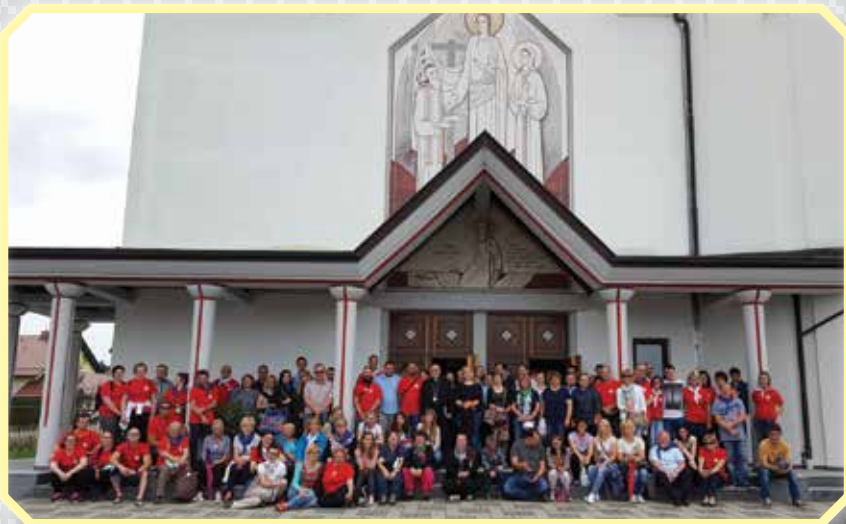
»Kar veliko se nas je zbralo...«