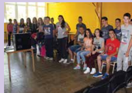
Učenci OŠ Vladimirci so nam predstavili svojo prostovoljsko akcijo