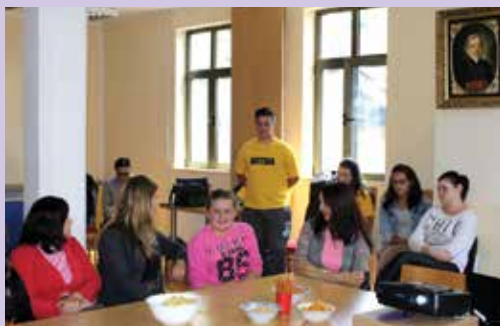
Predstavitve prostovoljskih akcij Aleksinac