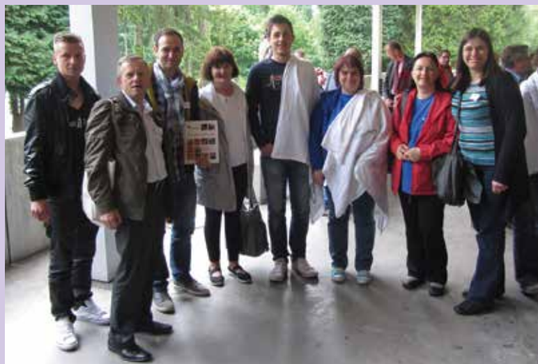
Celotna delagcija Slovenske karitas v Lurdu

Če je bila do sedaj najboljša regionalna konferenca v Sloveniji na Bledu, kjer smo začrtali temelje standardov trajnostnih socialnih sistemov, objavili analitični model pogleda Karitas na socialno varnost, pripravili nepozabno srečanje s tisoči protovoljcev Karitas iz vse Slovenije na Brezjah in duhovno bogato bogoslužje na blejskem otoku ter za vedno označili Slovenijo na zemljevidu Karitas, je bila letošnja konferenca v Lurdu zagotovo prelomna. Bila je pogumen korak Karitas in Cerkve v pravo smer: k človeku, k dialogu in sodelovanju z ljudmi, ki so Jezusovi 'najmanjši bratje'. Na Brezjah smo vsa prizadevanja Karitas za leto boja proti revščini in socialni izključenosti 2010 posvetili Mariji pomočnici, v Lurdu smo ji vsi skupaj izročili naša prizadevanja do konca desetletja. In bližina Brezmadežne na tem milostnem kraju je bila tudi za vso našo slovensko ekipo presežek ki ga tej konferenci moramo priznati. S Karitas, ki bo korakala v tej smeri, sem pripravljati iti do konca.