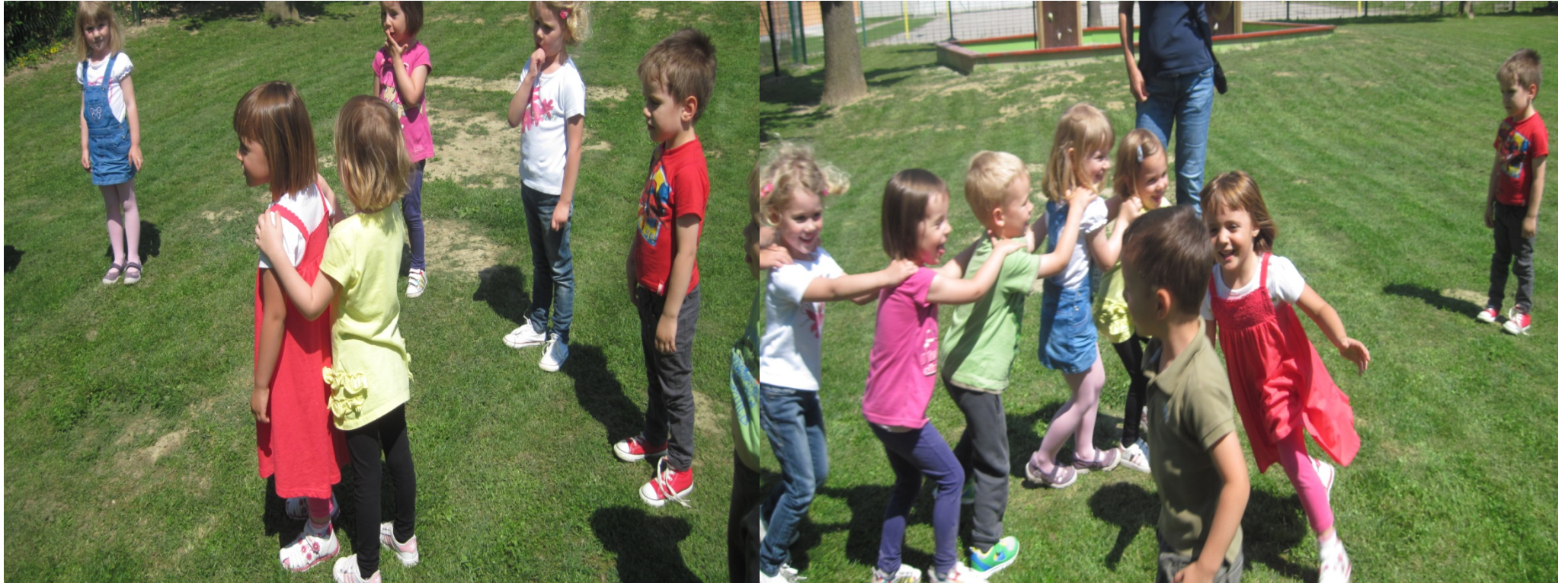
Naši radovedneži so zelo motivirani za nove gibalne igre in tako je videti, ko se mi igramo Mambo.