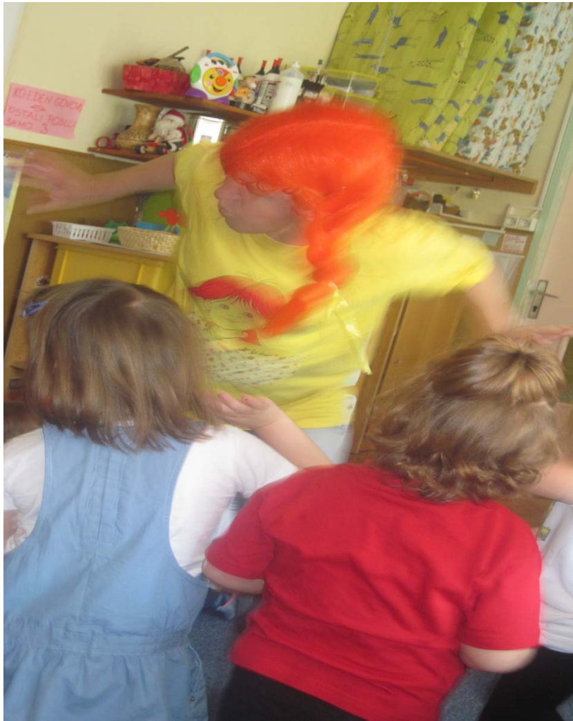
S Piko Nogavičko smo tudi zaplesali.