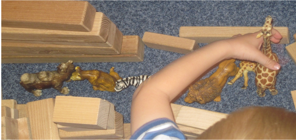
V kotičku, kjer imamo živali, so poiskali afriške živali in jim gradili dom.