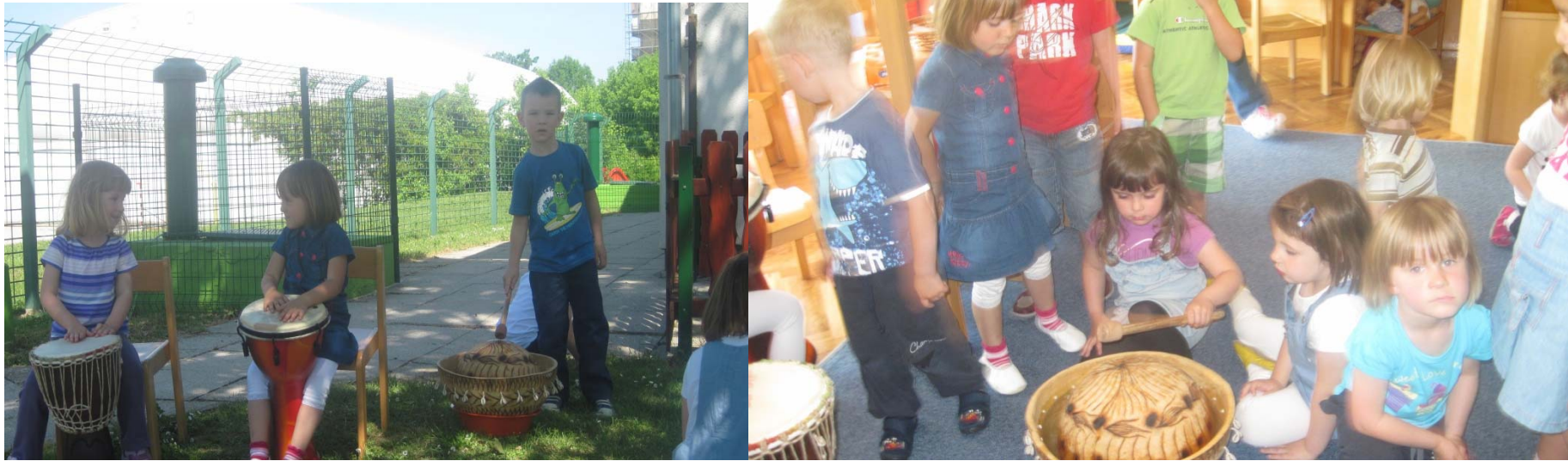
Ti bobni so super...