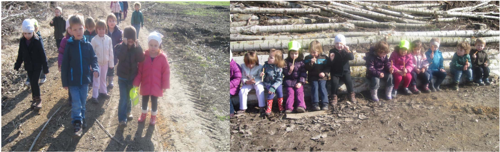
Veliko smo hodili na izlete in ugotovili, da se tudi peš daleč pride.