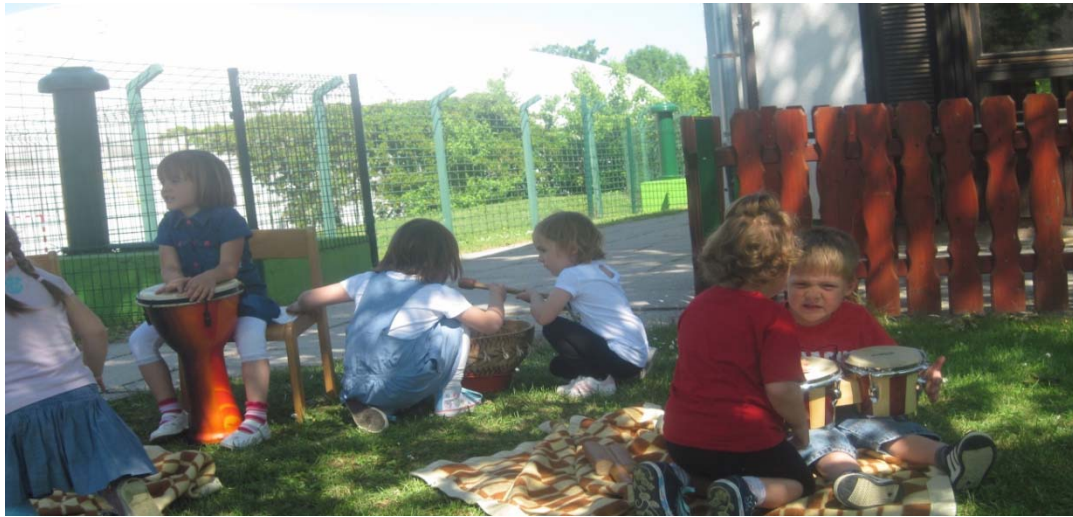
Otroci so uživali ob svoji glasbeni ustvarjalnosti...