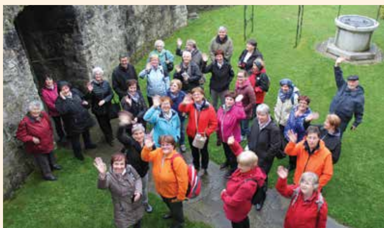
Ne le megli, tudi burji smo kljubovali z dobro voljo.