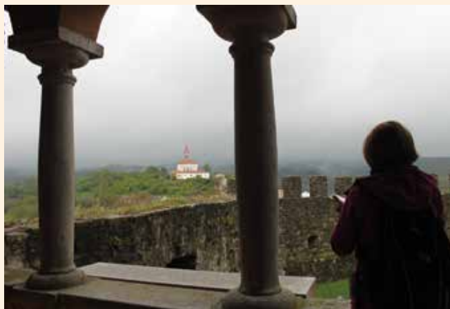
Vztrajnosti romarjev tudi megla ni kljubovala in pred nami je »zrasla« cerkvice sv. Helene na Premu.