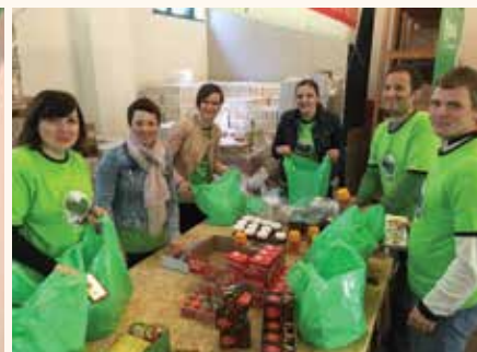
V Drgančevju smo s Krkaši pripravljali prehranske pakete.