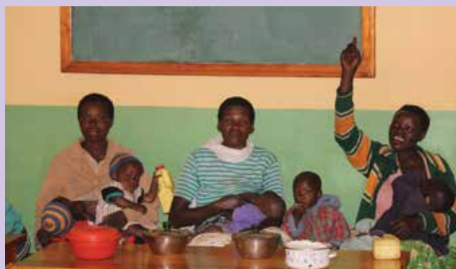
Matere s podhranjenimi otroki, ki pridejo v center v Mukungu po pomoč, so deležne tudi vzgoje o pravilni prehrani otrok in o higieni. Vsaka mama lahko vpraša, kar jo zanima.

To je bil projekt, ki smo mu na Slovenski karitas v preteklem letu namenili največ zbranih sredstev.