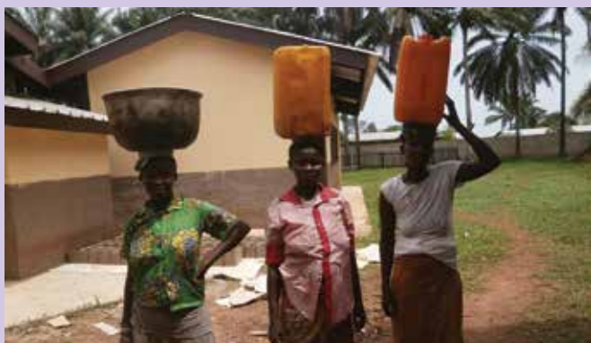
Ženske, ki so pomagale nositi vodo za gradnjo dodatnih prostorov za zdravstveni center v Safi in so na ta način tudi zaslužile za preživetje družin.