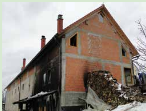
Požar je delno poškodoval stavbo v prenovi