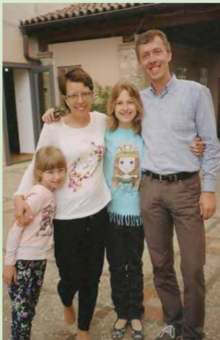
Naša družina praznuje 2. rojstni dan

misli, koliko stisk in težkih trenutkov prestajajo številni otroci okrog nas. Povejte svojim otrokom, da je vsaka družina prava družina. Ne glede na to, koliko članov šteje in kakšno zgodbo pripoveduje. Če le v njej vladata ljubezen in razumevanje.«