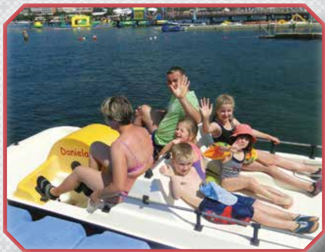
»Sončen pozdrav iz Portoroža – po dolensko.«