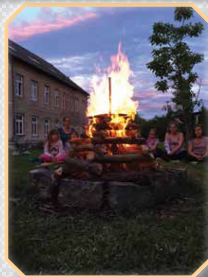
»Čarobnost večera in noči ob ognju.« Otroci na počitniškem taboru v škofijskem domu v Vrblju