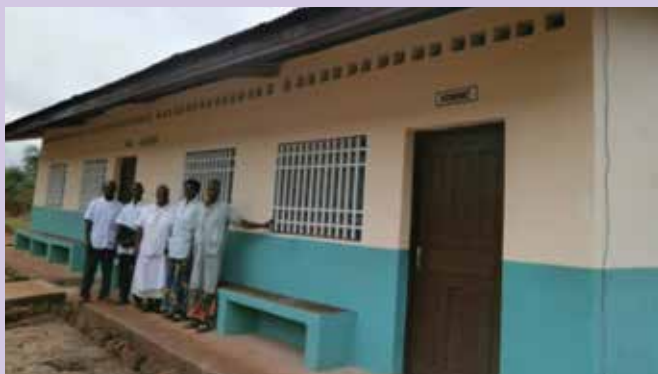
Dve novozgrajeni sobi za hospitalizacijo v Safi v Centralnoafriški republiki, kjer je največ malarije. Pomagajo tudi bolnikom s tuberkulozo in aidsom.

V Mukungu smo podprli tudi vzgojo za matere o higieni in primerni prehranski oskrbi otrok, še posebej za tiste s podhranjenimi otroki in v starosti do 5 let,