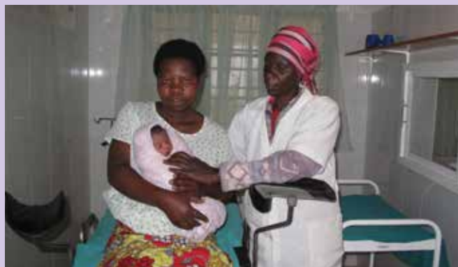
Prvi porod v obnovljeni porodnišnici v Mukungu. Ljudje v Ruandi se zelo razveselijo novega rojstva. Stara mama vedno zapleše ob rojstvu vnuka.