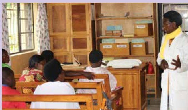
Samo mame, ki pridejo štirikrat na predporodna posvetovanja, prejmejo ob rojstvu otroka novo obleko zase, za novorojenčka pa vse prejmejo pleničke, kar podpiramo preko projekta MZZ.

lahko učili tukaj, in tudi mi kot družina si sedaj lahko kaj kupimo. Zahvaljujemo se za to pomoč.«