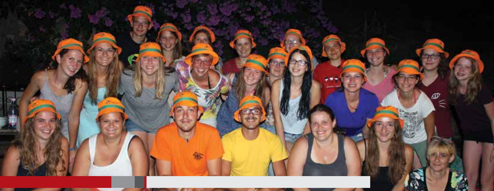
»Gremo novim dogodivščinam naproti!« Počitnice Biserov v Portorožu so se začele