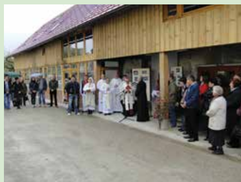
Blagoslov ob odprtju doma Skupnosti TAV