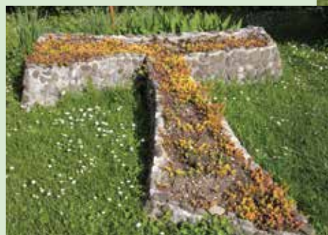
TAV – simbol Frančiškovih redov