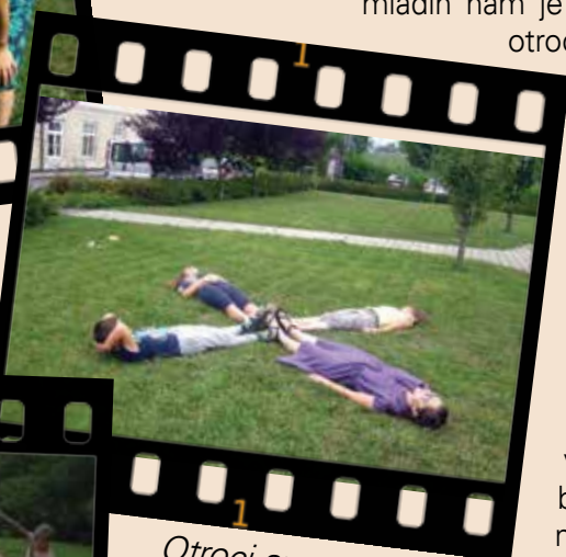
Otroci smo sonce, v lepem in manj lepem vremenu