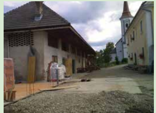
Župnijski hlev pred obnovo leta 2009

Temelj bivanja v skupnosti predstavlja dnevni red. Ravno zunanji red in jasna pravila so v pod-