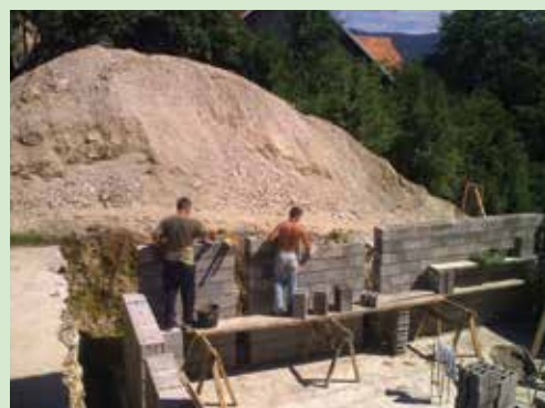
Od temeljev navzgor: gradnja hišnih temeljev se prepleta z gradnjo temeljev osebnosti