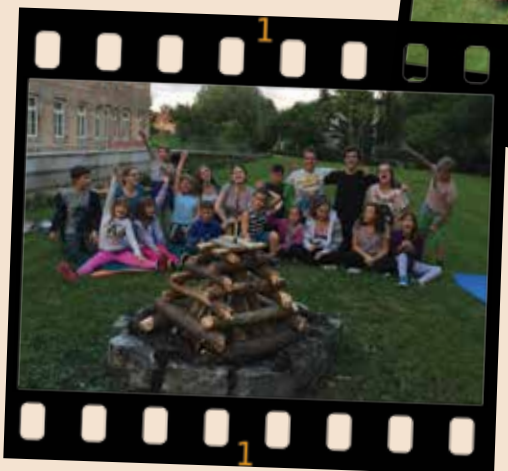
Večerja ob tabornem ognju

bila naša gostja tudi gospa, ki nas je naučila, kako z različnimi tehnikami in materiali narediti voščilnice za naše najbližje.