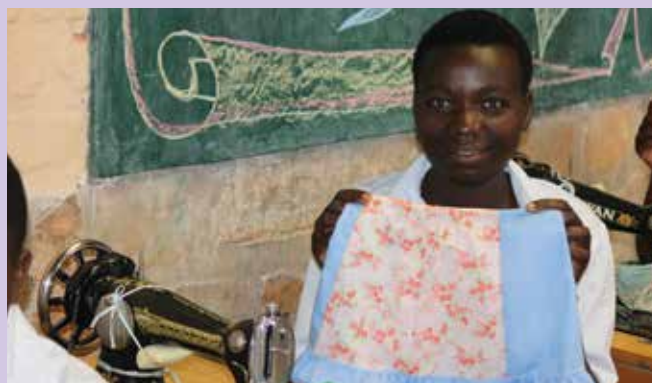
V okviru projekta MZZ RS se mlada revna dekleta usposabljujejo za poklic šivilje. Mnoge bodo na koncu dobile tudi šivalni stroj za domov.

V okviru zdravstvenih centrov v Mukungu in Musangu v Ruandi , ki skupaj oskrbujeta območje s 37.000 prebivalci, ob sofinanciranju projekta s strani Ministrstva za zunanje zadeve RS in v sodelovanju z misijonarko s. Vesno Hiti ter s pomočjo lokalnega zdravstvenega kadra podpiramo redno vzgojo o naravnem načrtovanju družine, zdravstveno vzgojo in oskrbo za nosečnice in porodnice , ki se jih ozavešča tudi o skrbi in cepljenju novorojenčkov . To ozaveščanje je za te kraje zelo pomembno, saj še vedno skoraj polovica mater rojeva doma in lahko zaradi zapletov pri ali po porodu izgubijo življenje matere ali otroci. Za vse tiste matere, ki so prišle v center na štiri predavanja