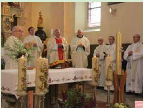
Duhovniki ob mašni daritvi, 10. obletnica Skupnosti TAV