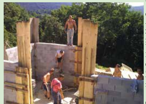
Fantje iz skupnosti TAV so vključeni v vsa dela pri gradnji novega doma