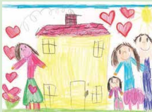
Mi štirje smo najlepši par

»Ljudje smo prav posebna bitja, vsak dan zremo v prihodnost z določenimi željami in pričakovanji, a večkrat se zgodi, da 'človek obrača, Bog obrne'. Tako se je zgodilo tudi naju, minevala so leta, a najin dom je ostajal prazen. Zaman sva upala, da ga bo nekega dne napolnil otroški smeh in razigranost. Odločila sva se za rejništvo. Spomladi 2014 sva čez noč postala starša, in to dvema deklicama – sestricama. Svet se nama je postavil na glavo, a s potrpežljivostjo in ljubeznijo sva premostila vse začetniške težave. Danes se nama zdi, kot da smo skupaj že celo življenje. Kaj je lepšega kot pogledati v radožive in iskrene otroške oči, slišati zvonki smeh in se z razigranostjo podati v nov dan. Hvaležna sva za to izkušnjo in čutiva, da se z njo vsak dan dotikava tudi soljudi v naši okolici. Hvaležna sva najinim staršem, ki so deklici sprejeli za svoji. Nikoli prej nisva niti po-