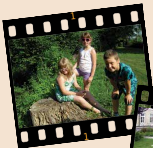
Ob reki pravo morsko vzdušje

Od 11. do 15. julija smo v škofijskem domu Vrbje pripravili počitnice za otroke v starosti od sedem do petnajst let. Kar 16 otrok se je odločilo, da se pridružijo našemu programu. Posebna dogodivščina otrok je med drugim bila, da so v noči s četrтка na petek v domu tudi prespali, si ob ognju pripravili večerjo in s skavti, ki so se jim pridružili ta večer, pripravili predstavo o Ostržku. Otroci so vsak dan uživali ob različnih delavnicah, vodnih igrah in sestavljanju fotostripa. Fotostrip pomeni, da so otroci po skupinah, vsak dan na določeno temo, ki jih najbolj zanima – morje, prijatelji, prosti čas ... – posneli fotografije in jih na koncu sestavili v smiselno zgodbo, ki so jo delili z drugo skupino. Fotostrip je bil še en dokaz, da otroška domišljija ne pozna meja. Poleg skavtov je