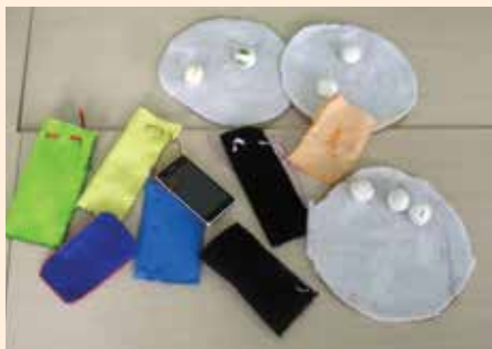
Preizkusili smo se v šivanju žepkov za mobilitel ali peresnic. Nekateri pa so izdelovali tarče za metanje kroglic.