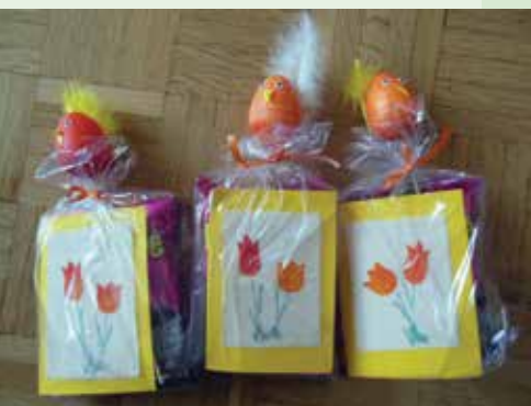
Na sliki so darila, ki jih naše sodelavke raznosijo ob praznikih, ko obiskujejo bolne in ostarele. To je pomembno področje delovanja, ki je skrito očem, se ne kaže navzven, vendar prinese veliko blagoslova, upanja in zavedanja, da kljub odsotnosti iz javnega življenja lahko ostaneš človek s svojo identiteto in ljubeznijo.