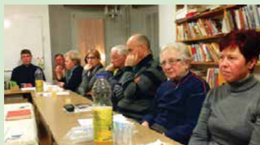
16. marca smo imeli občni zbor Župnijske karitas Škofja Loka. Po pregledu dela za nazaj in načrtih za naprej smo imeli tudi pogostitev, ki jo pripravimo kar sami. Ob spodbudnih besedah in zahvali g. župnika so se ogrela tudi naša srca.