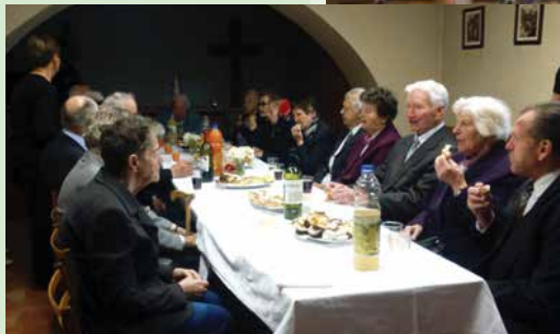
V mesecu maju vsako leto povabimo starejše, bolne in invalide k sveti maši, po njej sledi pogostitev v avli župnišča. Stari prijatelji se srečajo, obujajo spomine in so zelo hvaležni.