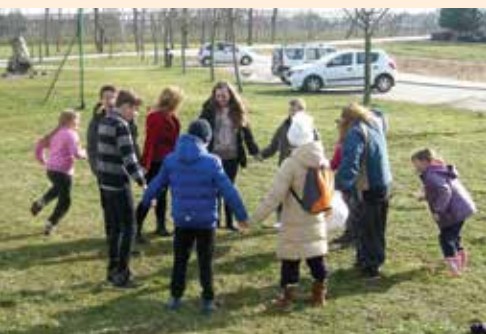
Miška, ali imaš kaj sira zame?

V Škofijskem domu Vrbje smo v počitniškem času izvajali počitnice za osnovnošolske otroke. Poleg športnih iger na prostem in v učilnici smo se preizkusili tudi v kuharskih veščinah. Pomagali smo pri pripravi kosila in seveda tudi sladice. Otroci so se zelo zabavali, spletili nova prijateljstva in izrazili željo po novem srečanju v naslednjih počitnicah. Voditeljici počitniškega tedna sta resnično zadovoljni in ponosni.