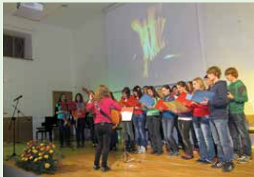
Naslov naših koncertov je Mladi za Karitas. Mladinski pevski zbor prepeva že mnogo let, fotografija je bila posneta na enem izmed koncertov, kjer so obogatili program.

Vsi sodelavci delamo prostovoljno in letno opravimo preko 9.500 ur prostovoljnega dela. Delujemo na dveh lokacijah: sredi mesta, kjer delimo hrano ter svetujemo, in v starem uršulinskem samostanu. Povsod pa so za naše sodelavce in stranke prostori precej neprijazni, ker je zelo mrzlo. Mogoče se nam kdaj nasmehne sreča in bomo lahko vse oblike pomoči nudili v prijaznejših prostorih in na enem mestu. •