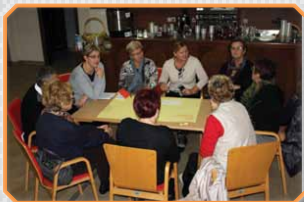
»Ali lahko postavim mejo?« Delo v delavnicah na seminarjih Karitas