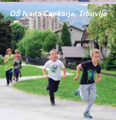
OŠ Ivana Cankarja, Trbovlje