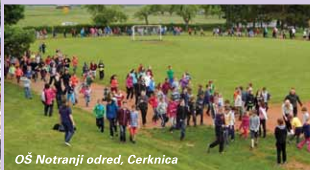
OŠ Notranji odred, Cerknica