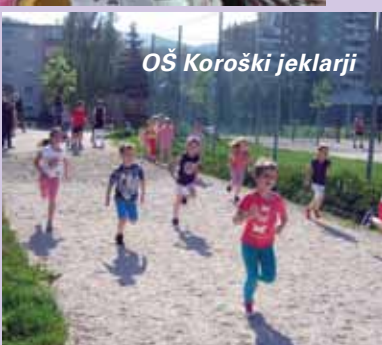
OŠ Koroški jeklarji