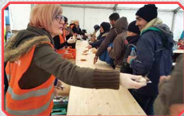
Sodelavki mariborske Karitas pri razdeljevanju hrane v zbirnem centru v Šentilju

QR koda za dostop do Žarka dobrote na internetni strani preko sodobnih spletnih bralnikov.