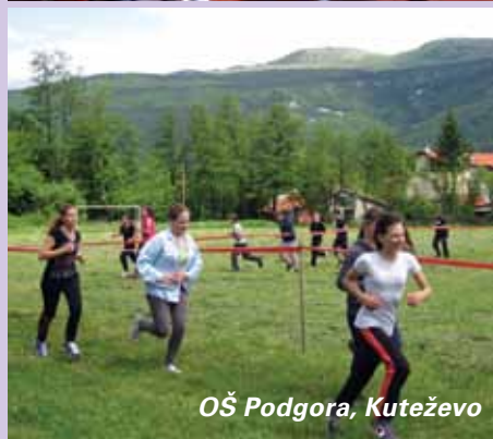
OŠ Podgora, Kuteževo