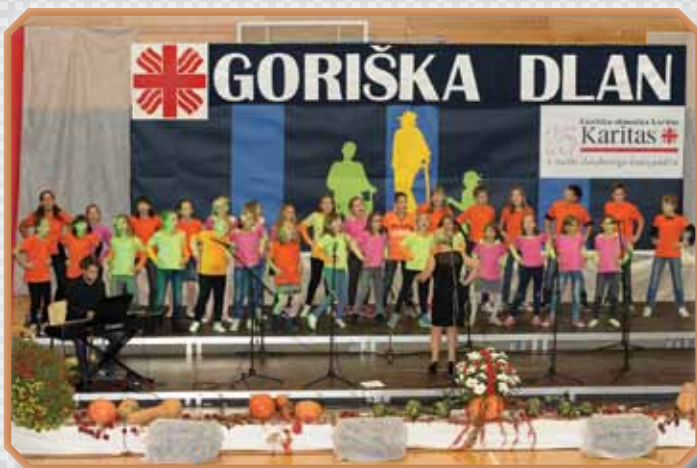
Mladi pevci na dobrodelnem koncertu Goriška dlan

»Kako lepo se je srečati in obupati spomine na poletne dni!« Mladi prostovoljci Počitnic biserov na zaključnem pikniku