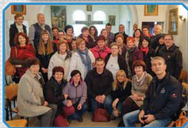
Skupina umetnikov in sodelavcev Karitas v Slovenskem pastoralnem centru v Bruslju po končani sveti maši.