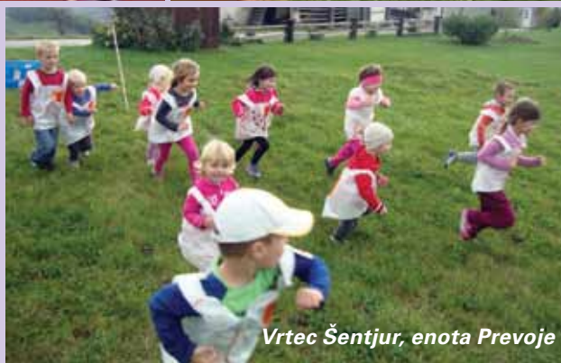
Vrtec Šentjur, enota Prevoje