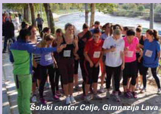
Šolski center Celje, Gimnazija Lava