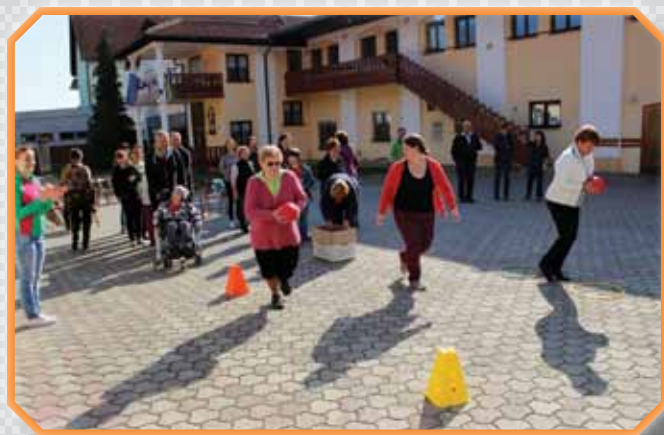
Pomembno je sodelovati, ne zmagati!« Na srečanju z otroki in njihovimi družinami v Cerkljah