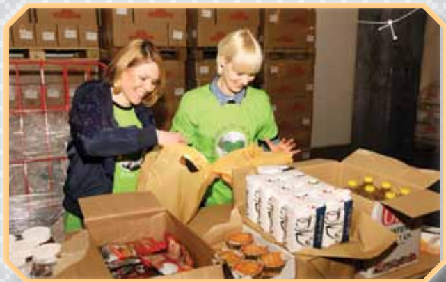
»Ali sem vse dala v vrečko?« Zaposleni iz tovarne Krka pomagajo pri pripravi paketov ŠK Novo mesto