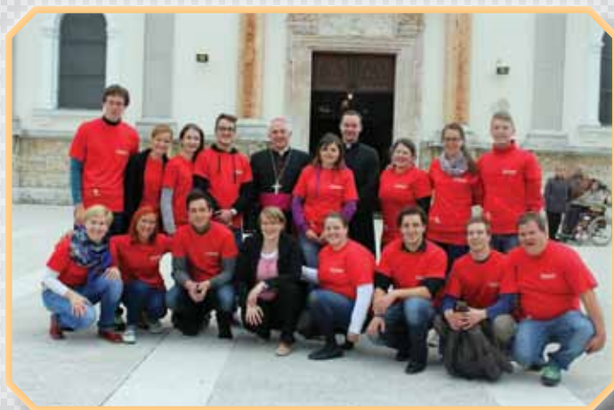
»Še skupno sliko za na Facebook!« Prostovoljci, ki so pomagali pri zahvalni maši na Brezjah, z nad- škofom Stanislavom Zoretom