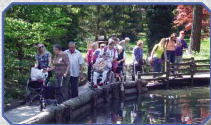
»Kako prijetno je v tem zelenju in miru, ki nas obdaja ...« Stanovalci Doma Lenart na izletu v Mozirskem gaju

QR koda za dostop do Žarka dobrote na internetni strani preko sodobnih spletnih bralnikov.