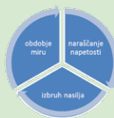
Diagram nasilja: Nasilje nad ženskami – pravne poti v varno življenje žensk in otrok, DNK 2014

- Tretja faza je obdobje navideznega miru, v katerem povzročitelj poskuša zmanjšati pomen nasilja ali prevaliti krivdo za nasilje na žrtev. Povzročitelj se lahko sramuje svojega dejanja, prepričuje žrtev, da se nasilje ne bo več ponovilo, se opravičuje, morda kupuje darila in je do žrtve prijazen. Ravno zaradi tega se žrtve v tej fazi težje odločijo za odhod, saj verjamejo, da se bo partner res spremenil.