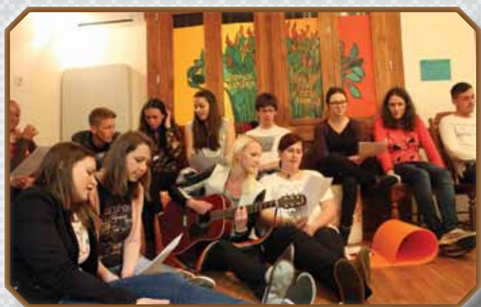
»Pesem nas druží!« Mladi animatorji na pripravah v Portorožu