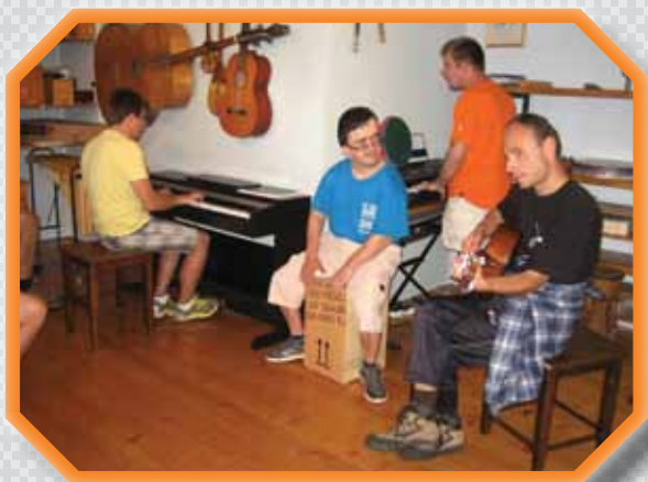
Glasba nas povezuje.

QR koda za dostop do Žarka dobrote na internetni strani preko sodobnih spletnih bralnikov.