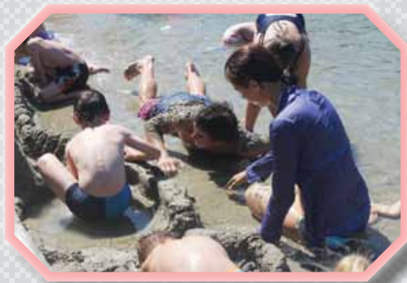
Mi smo BISERI, smo zelo NAVIHANI.