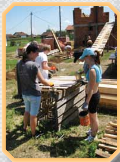
Dobro se znajdemo v tej "likovni delavnici".