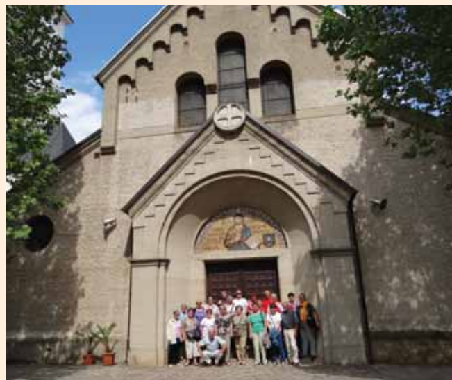
Člani ŽK Štepanja vas pred cerkvijo v Turnišču

nostjo sprejela Božjega Sina, obiskala svojo teto in ji pomagala. Spremljala je Jezusa in bila z njim vse do njegove smrti.