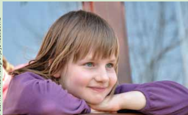
fotografija je ilustrativna

Socializacija: Avtizem se od drugih razvojnih motenj razlikuje po težavah na področju socializacije. Skupno vsem ljudem z avtizmom pa je, da se težko »vključijo«,