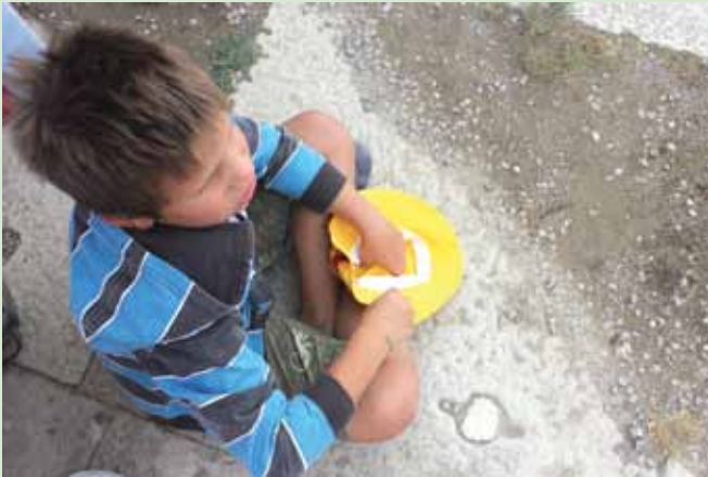
fotografija je ilustrativna

hojo ali vzorce gibanja. Lahko so zelo odvisni od rutine in želijo, da so stvari vedno enake. Ne marajo sprememb ali presenečenj. Že majhne spremembe v okolju ali dnevni rutini, ki ljudem običajno ne povzročajo težav (npr. oblačenje po drugem vrstnem redu, druga pot v šolo ...), so lahko zanje stresne in jim povzročajo tesnobo.