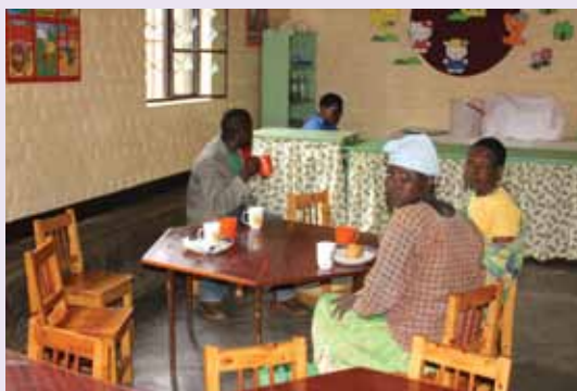
Kantina v ZC v Mukungu