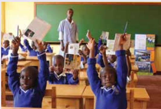
Šola v Kigaliju