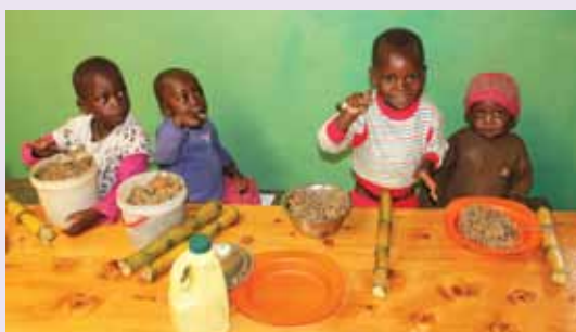
Podhranjeni otroci v Mukungu