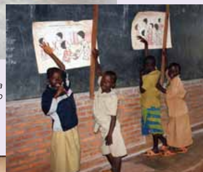
Vaška šola v Ruzo