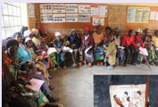
Vrsta za oskrbo v ZC v Mukungu

jih vedno zelo premišljena. V Mukungu sem v nekaj dneh lahko videla, kakšen je utrip življenja na vasi in v zdravstvenem centru, ki ga vodi s. Vesna in katerega obnovo smo podprli na Karitas. V njem je zaposlenih 40 lokalnih delavcev. Dnevno pride po pomoč do 150 ljudi. Največ je boleznih dihal, črevesnih boleznih, podhranjenosti, AIDS-a in malarije, podobno tudi po drugih zdravstvenih centrih, ki jih podpiramo v Burundiju. Imajo tudi center za podhranjene otroke, ki ga sploh ne bi smeli imeti, ker v Ruandi uradno ni več podhranjenih otrok. Politiki namreč želijo dati sliko, da gre državi 20 let po genocidu dobro. Dejansko pa je do 30 % otrok, ki jih pripeljejo v zdravstveni center, podhranjenih. Z lansko-