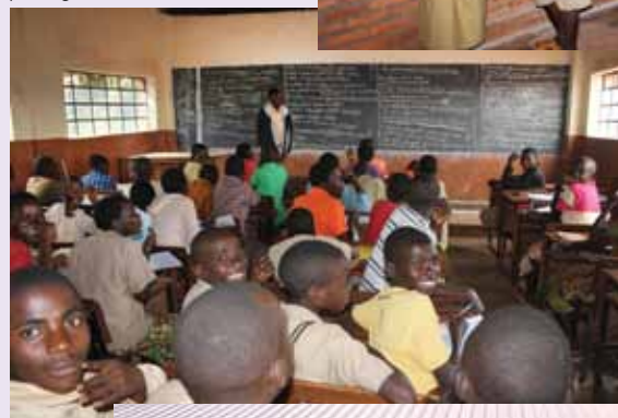
Otroci v šoli v Rwisajju, ki smo jo preko Za srce Afrike pomagali obnoviti v letu 2013