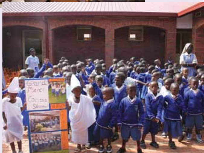
Otvoritev nove šole v Kigaliju