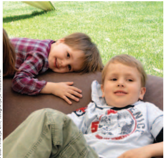
fotografija je ilustrativna.

Vloga rejnika: Vodilno vlogo imajo rejniki, ki otrokom pomagajo prepoznati njihova lastna občutja in jih tudi poimenujejo (si utrujen, vesel, razburjen ...). Otrokom pomagajo regulirati tudi telesna stanja, ko ga objamejo, potolažijo. Brez tovrstnih izkušenj bi otrok odraščal, brez da bi prepoznaval svoja čustvena in telesna stanja, primanjkovalo bi mu samozaupanja in zaupanja v svet. Ker je odraščal v nevarnem okolju, mu varnost s strani rejnikov prinese zmožnost umiritve.