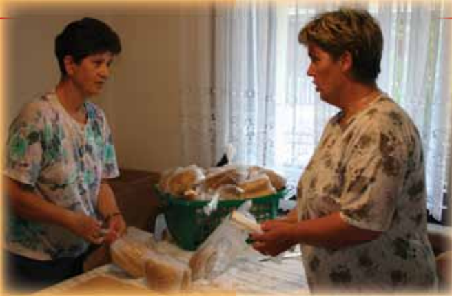
Na obisku v ŽK Štepanja vas, Julij 2005