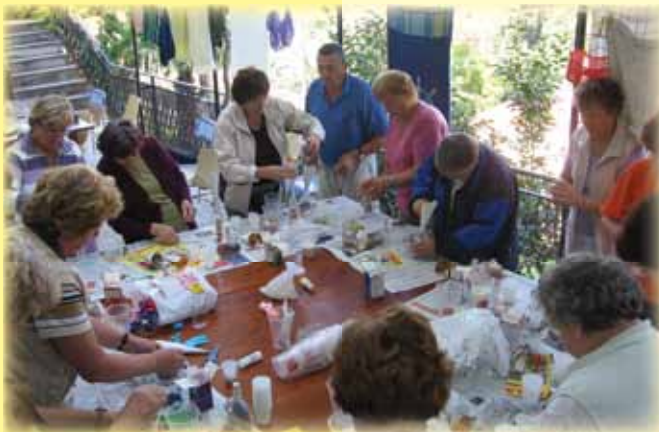
Počitnice sodelavcev Karitas, oktober 2007