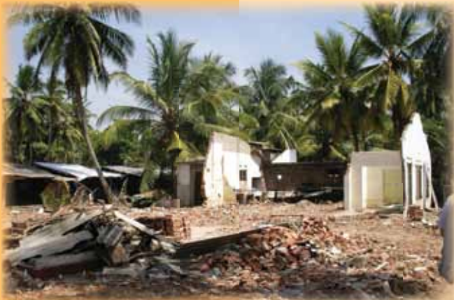
Sri Lanka po katastrofalnem cunamiju, 2005