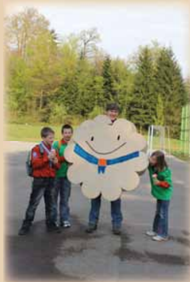
Piškotek dobrotek, maj 2011