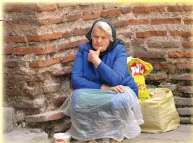
Revščina, julij 2008

V letu 2006 se je v Karitas na Slovenskem začel pripravljati nov strateški načrt delovanja Karitas in v okviru tega so se oblikovale Temeljne vrednote in načela. Tako smo z začetkom leta začeli v rubriki Slovenska Karitas v posebni podrubriki predstavljati temeljne vrednote in načela, o katerih so razmišljali tudi sodelavci Karitas ali druge znane osebe: družina, človekova enkratnost in dostojanstvo, zaščita človeškega življenja, zagovorništvo in opolnomočenje drugih, nepridobitnost in preglednost poslovanja, solidarnost in subsidiarnost, skupna