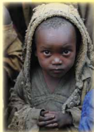
AIDS zaznamuje Afriko, januar 2009