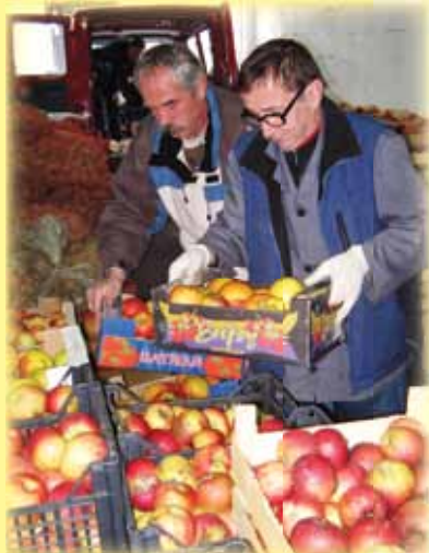
Maribor - akcija Ozimnica, december 2008