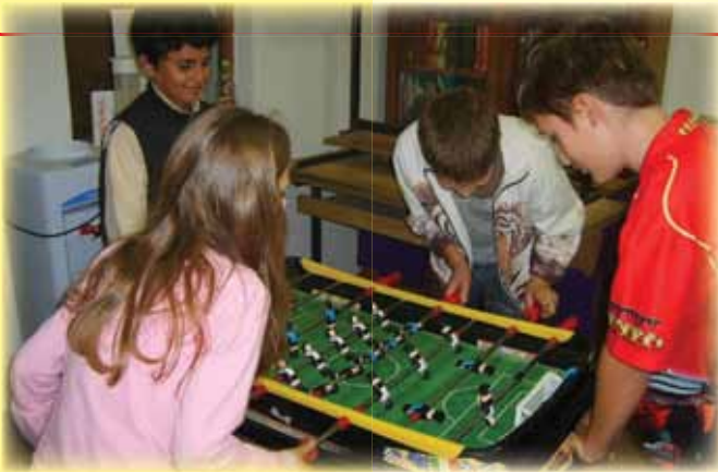
Preventivni program Popoldan na Cesti, januar 2007