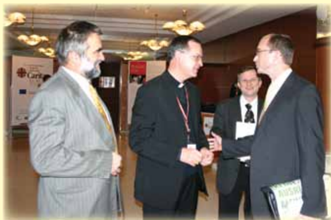
Regionalna konferenca Caritas Europa, maj 2008

Tudi v tem obdobju smo bili Na obisku pri ŽK Ljubljana Šiška, ŽK Mozirje, Vincencijeve zvezi dobrote, Svetopisemski družbi Slovenije, društvu Družinski center Betanija in Kolpingovem združenju Slovenije.