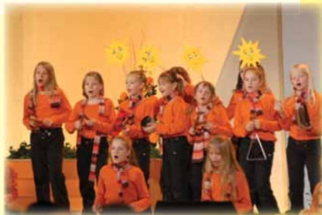
Klic dobrote, december 2006

V okviru te rubrike smo nadaljevali s predstavljanjem Posebnih stisk, in sicer: gluhi, družine z odvisniki – zasvojenimi in možnosti pomoči, prebežništvo – migracije, nasilje nad otroki, osebe z motnjo v duševnem razvoju, stiske po svetu, Romi, droga in čustva. Septembra 2007 pa smo začeli z razmišljanjem o družinskih stiskah: vzgojni problemi, bolezen v družini, ob odhodu otrok iz družine, medgeneracijske težave, medgeneracijski prenos zasvojenosti, družina v objemu alkohola, problem vlog v družini, nasilje v družini, zadolženost družin, usklajevanje družinskega in poklicnega življenja, brezposelnost, neplodnost parov. Septembra