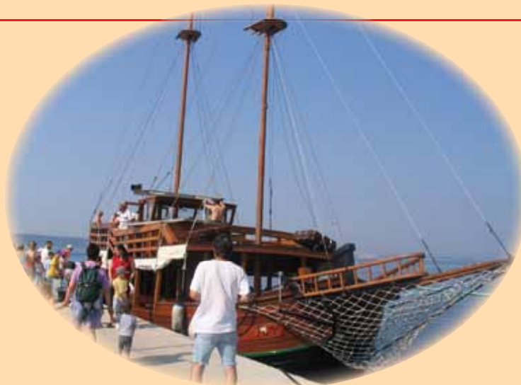
Letovanje družin, avgust 2004