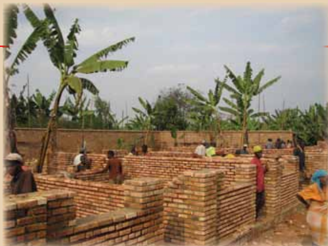
Gradnja dodatnih prostorov zdravstvenega centra Rwisabi, september 2008

Maja 2010 smo oblikovali posebno številko Žarka dobrote ob praznovanju 20-letnice ustanovitve Slovenske Karitas in s tem obeležili to lepo obletnico.