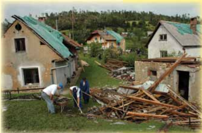
Posledice neurja, julij 2008