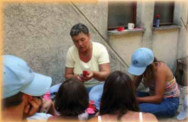
Počitnice Biserov, avgust 2005