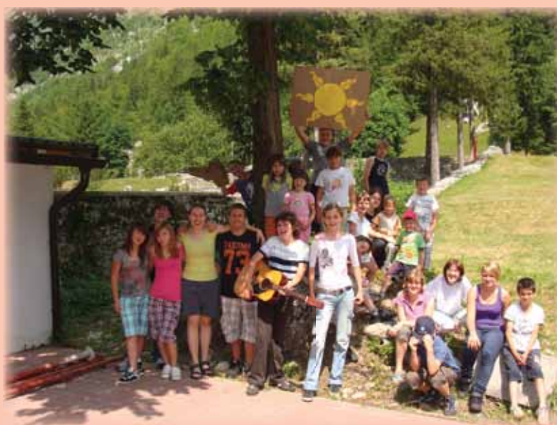
Poletni tabor v Soči, avgust 2010

Ob prebiranju se navdušim za tisto »malo več«, kot zahteva (že tako karitativna ...) služba. Mi, ki že po službeni dolžnosti delamo dobro za ljudi, lahko hitro izgubimo zavest, da smo kot kristjani dolžni delati tudi zastonska dobra dela. V Žarku pa me neštete ure in ideje prostovoljcev opogumijo in spodbudijo k posnemanju. In končno mi ta »dolžnost« prinese še največ veselja. Soočim se z izzivi stiske, ki je mnogo večja od mojih »nerešljivih« problemov, in mi posveti žarek za naslednji korak.