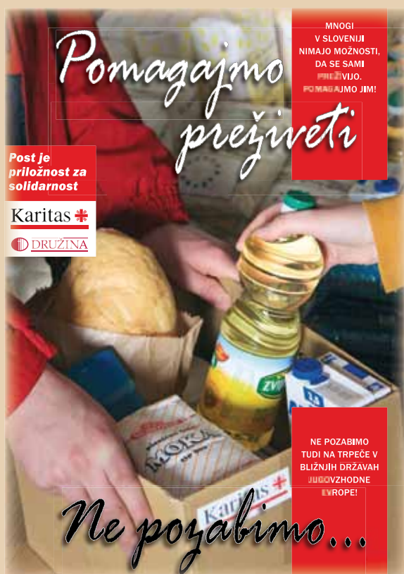
Plakat POST, april 2010

Ni toliko pomembno, kaj izberem, tudi ni treba komu razlagati odločitve. Pomembna je doslednost in notranja zvestoba izbrani odločitvi. Nedeljska sveta maša in izpraševanje vesti pred njo je pa tako lepa redna priložnost za preverjanje uspešnosti in za nove potrditve že izbrane odločitve. Sveti Duh, daj moči kreposti prave, da premagamo skušnjave!