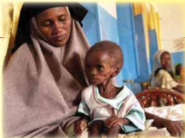
Darfur-podhranjeni otrok marec 2006

V začetku leta 2006 smo popolnoma preuredili zunanjo podobo Žarka dobrote in začeli z barvnim tiskom, kar je Žarek dobrote nekoliko bolj približalo reviji. Z nami je začel sodelovati oblikovalec Sine Kovič in podjetje Trajanus, d. o. o., iz Kranja. Ob tem smo povečali tudi naklado na 5.000 izvodov