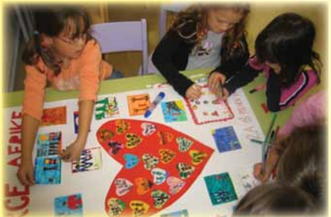
Otroci rišejo za srce Afrike, december 2007