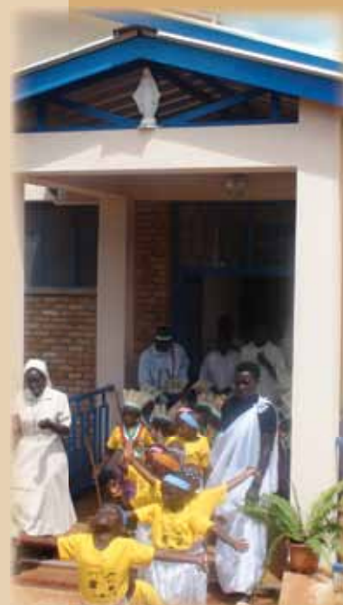
Blagoslov nove porodnišnice v Burundiju, junij 2010

Človekovo dostojanstvo je tudi za karitativnega delavca najpomembnejša vrednota. Vse oblike pomoči, ki jih nudimo, dajemo zato, da bi lahko tudi drugi živeli bolj v skladu s svojim dostojanstvom, ki ga imajo od Boga. Enako človekovo dostojanstvo vseh nam narekuje temeljno spoštovanje do vseh, tudi do revnih, do ljudi, ki so zaradi revščine pogosto nevzgojeni, nekulturni, robati, zagrenjeni ... Ker jih nihče ne spoštuje, so izgubili spoštovanje do sebe in do drugih. Če pa od karitativnega delavca doživijo spoštljivo naklonjenost, doživijo največ, doživijo, da jim nekdo vrača temeljno Božjo dobrino, njihovo dostojanstvo.