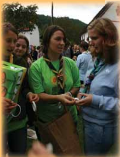
Stična mladih 2005, Povabilo mladih k dobrodelnosti, oktober 2005

Tretja večja podrubrika pa je bila Vi sprašujete, strokovnjaki odgovarjajo, kjer so na vprašanja bralcev in iz foruma odgovarjali strokovni delavci Karitas za področje pomoči ženskam in materam v stiski, za področje pomoči odvisnikom, za področje materialne pomoči in delovanje ŽK, za področje pomoči starejšim ter za področje pomoči brezdomcem.