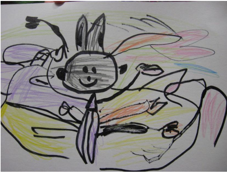
META- to je opica