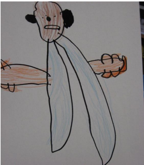
JAKOB- to je opica