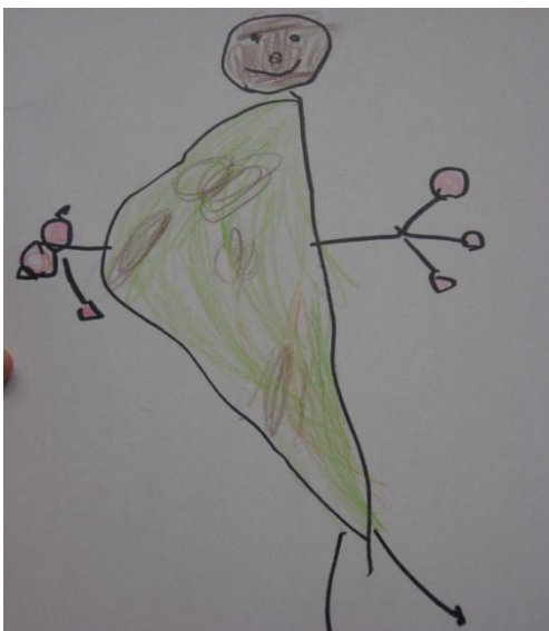
NEŽA- to je krokodil