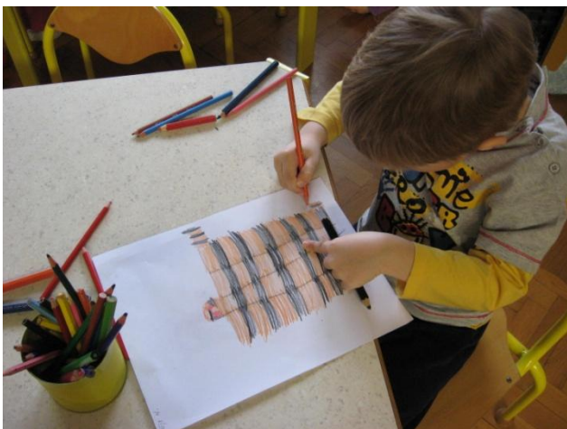
Jošt : rišem tigra