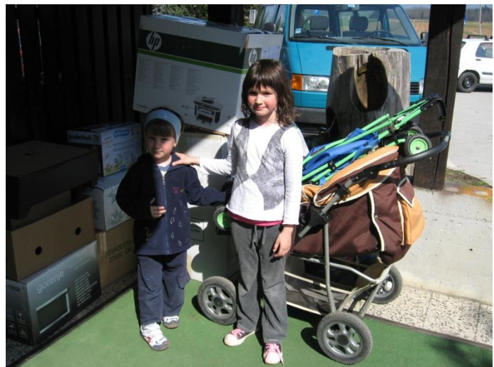
zbiramo za Karitas Kranj