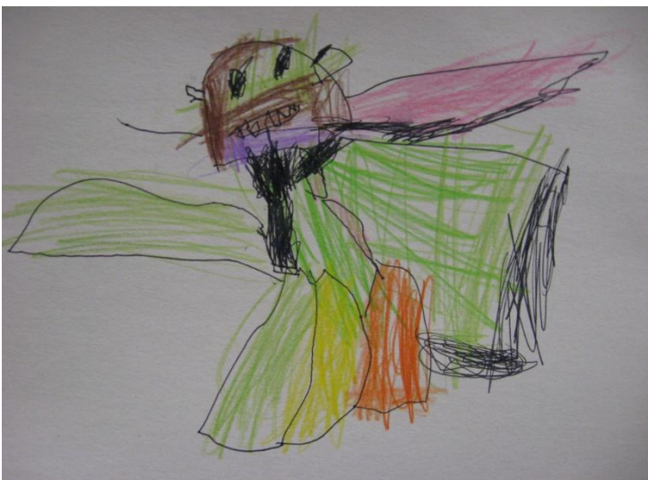
ULA- to je lev