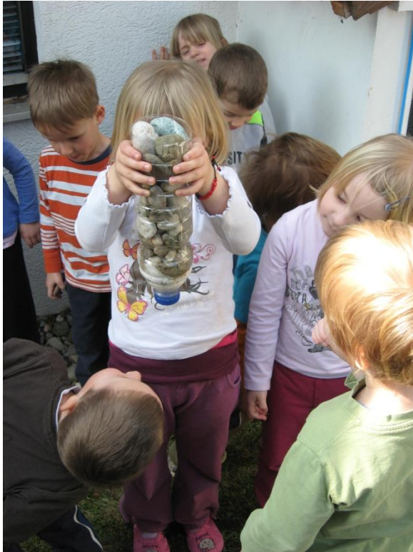
Enostaven eksperiment : kako očistimo vodo