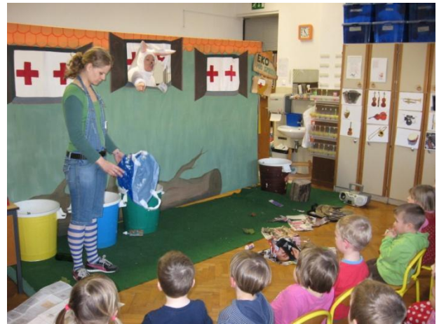
Eko pod zeleno smreko