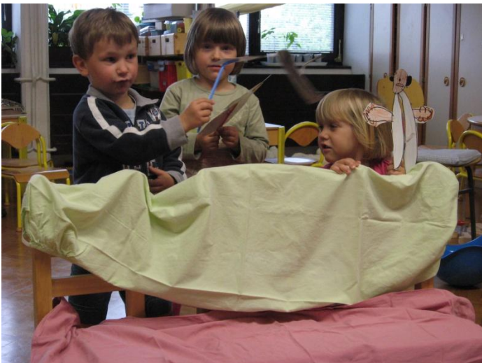
igramo se gledališče