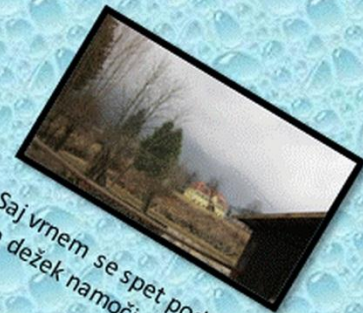
Saj vrnem se spet pod goro, ko dežek namoči zemljo.