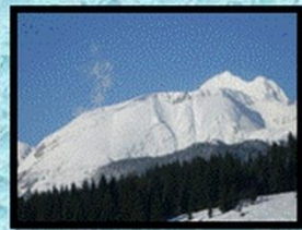
Kje domek je tvoj mi povej... Moj domek je tam pod goro...