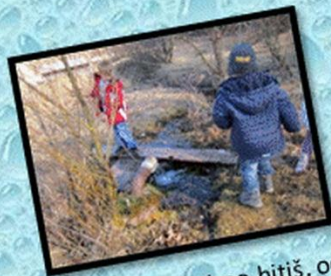
Zakaj pa nemirno hitiš, od doma in ptičkov bežiš?