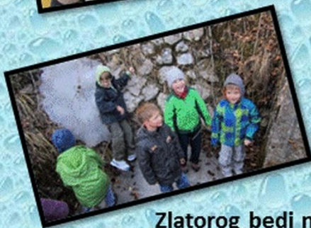
Zlatorog bedi nad Bohinjskimi vodami in gorami....